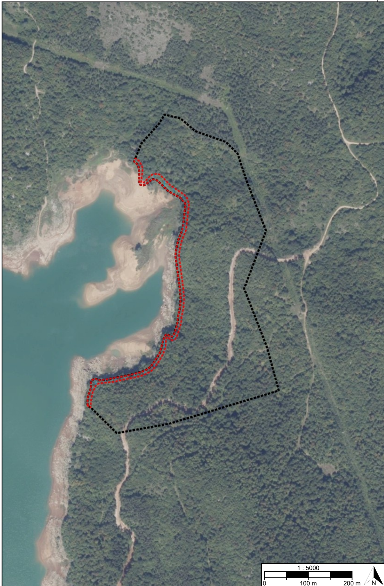
Postupak transformacije Urbanistički plan uređenja zone sporta i rekreacije "Mlakve" (oznaka "Rd")